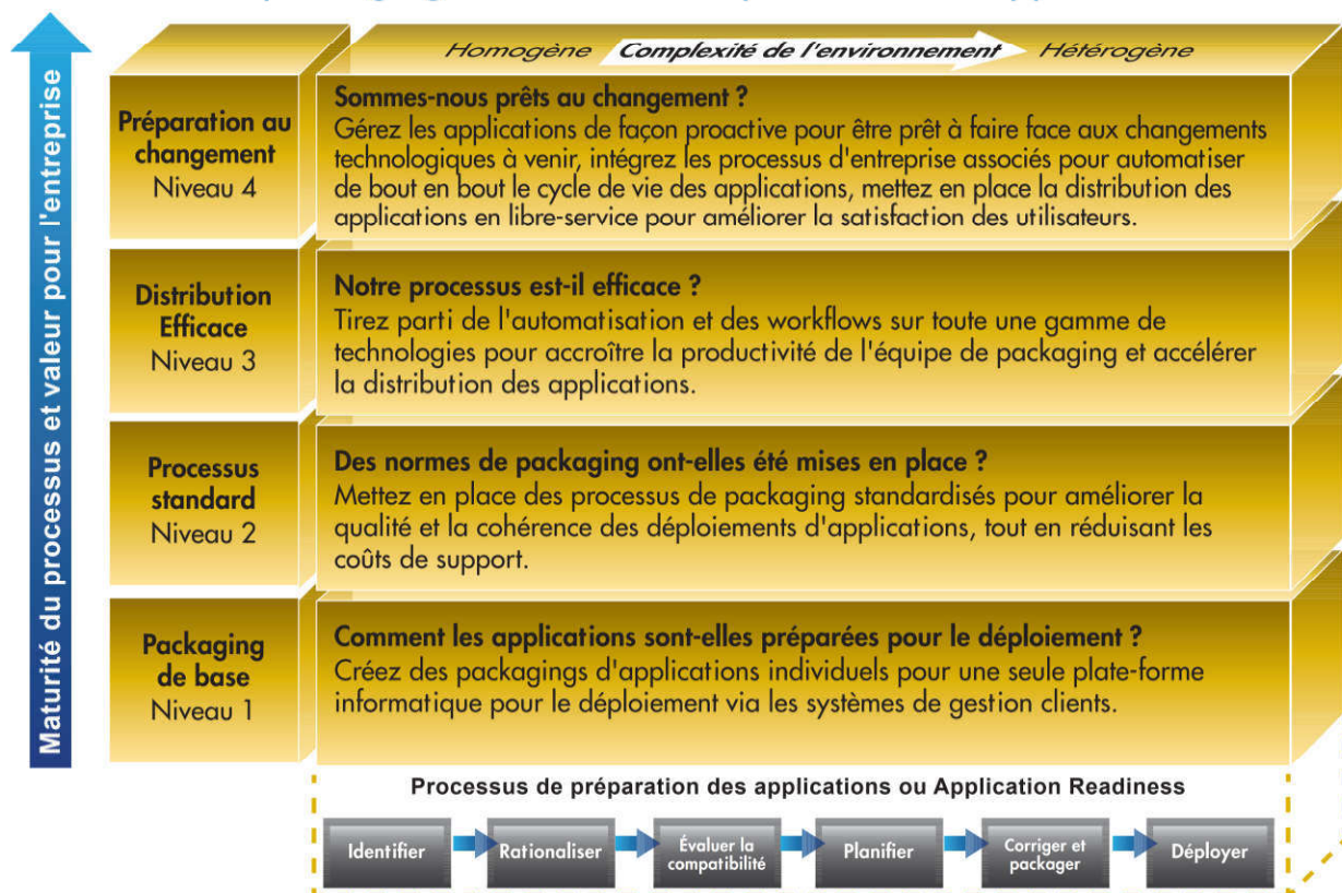
Figure 2 : Le modèle de maturité d'Application Readiness définit la voie à suivre pour générer plus de valeur métier.